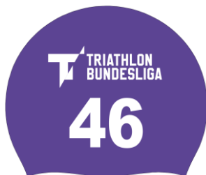
Beispiel einer Schwimmkappe