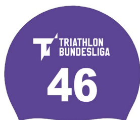
Beispiel einer Schwimmkappe