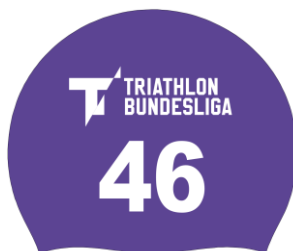
Beispiel einer Schwimmkappe