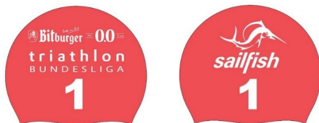
Beispiel einer Schwimmkappe